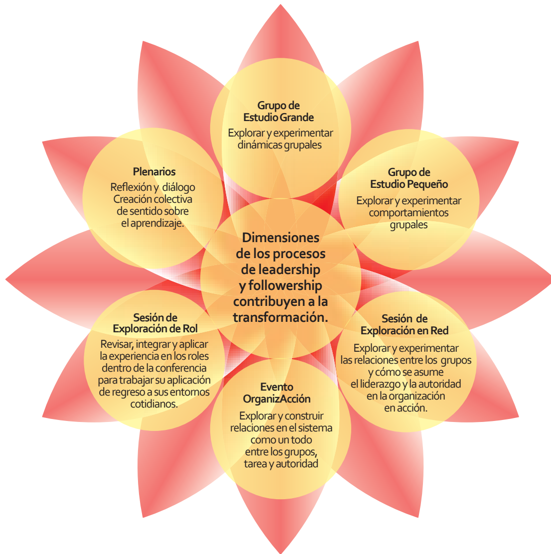
Gráfico adaptado de Group Relations India

Aprenderás de la experiencia a través de una serie de eventos: